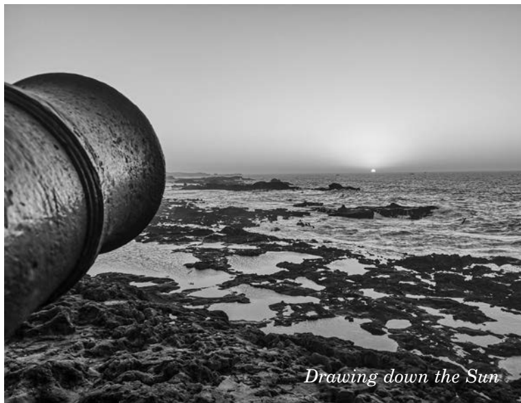
Drawing down the Sun

Gianni Carbotti , da anni collaboratore di Agenzia Radicale e Quaderni Radicali in qualità di fotoreporter e articolista, concepisce le forme di espressione creativa cui si dedica come parti d'un estenuante flusso di coscienza indistinguibile ed inscindibile dalle esperienze quotidiane della sua esistenza. La fotografia, insieme alla musica rock e al cinema, costituisce una delle passioni che hanno accompagnato fin dalla giovinezza e in maniera costante tutte le fasi della sua vita... Sobborghi poveri o pittoreschi di grandi città, musei di quart'ordine spesso legati al bizzarro, nani, travestiti, omosessuali, nudisti, disabili, ma anche gente comune in atteggiamenti incongrui, che sono catturati dall'occhio della sua fotocamera... con chiaroscuri fortemente marcati volti ad accentuarne l'unicità, la struggente bellezza e dignità che la diversità conferisce agli individui, al di là di qualunque stereotipo o pregiudizio.